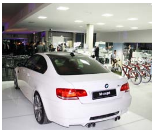
Ein Traum in weiß